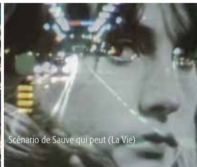
Scénario de Sauve qui peut (La Vie)