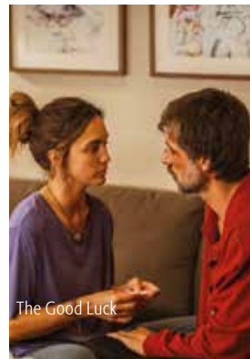
The Good Luck