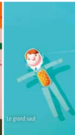
Le grand saut