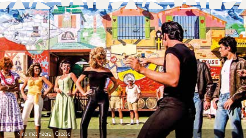
Kino mat Häerz | Grease