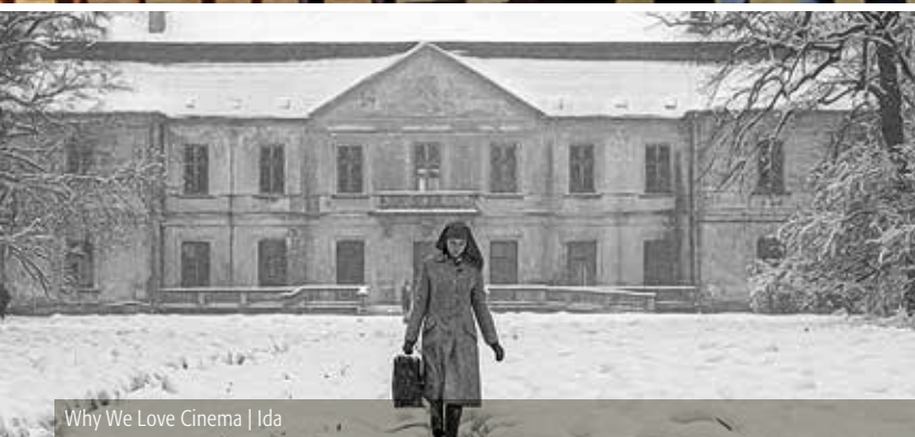
Why We Love Cinema | Ida