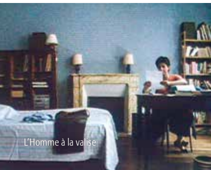
L'Homme à la valise

France 1980 | Jean-Luc Godard | documentaire | vo | 21'