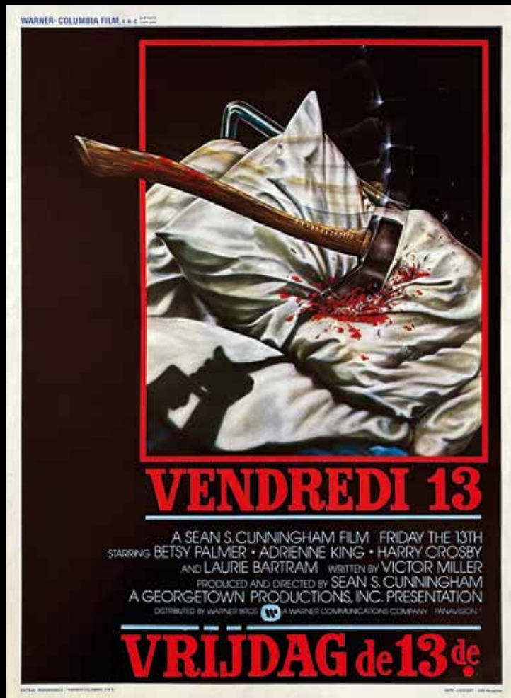
Poster #198: Friday the 13th (1980) Film de Sean S. Cunningham | affiche 35,5cmx54cm

Collect the treasures from the Cinématique's Poster Archive!