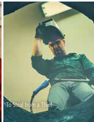
To Steal from a Thief